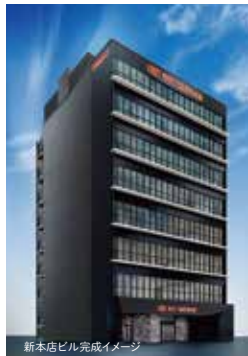
新本店ビル完成イメージ

当金庫は、令和4年10月に創立97年となり、来るべき創立100周年に向け、これからも地域の皆様のために尽力してまいります。現在高田馬場の本店ビル新築が進んでおり、令和5年12月頃には完成の予定です。なお、完成までの間、下記の仮店舗にて営業しておりますので、宜しくお願い申し上げます。