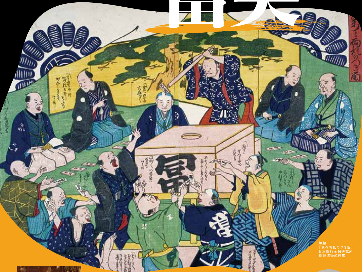
錦絵 「萬々兩札のつき留」 日本銀行金融研究所 貨幣博物館所蔵