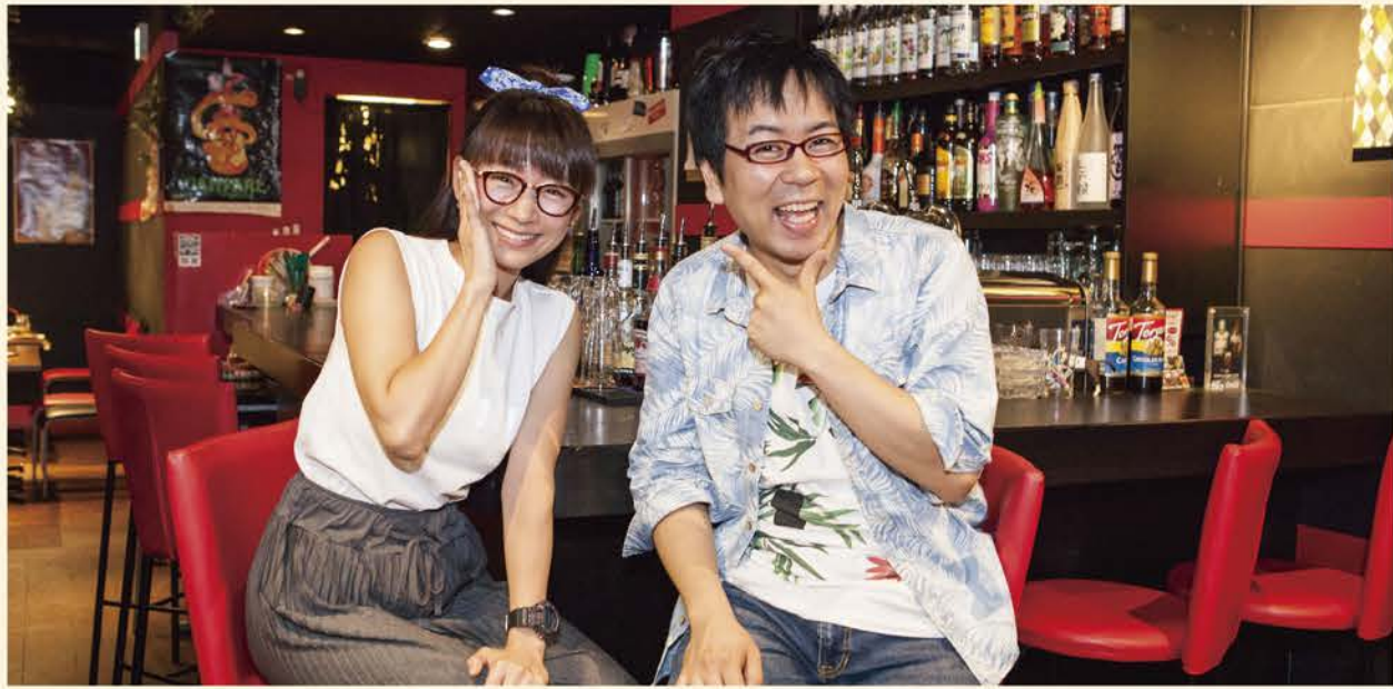
Text: 福井万里

馬場在住のものまね芸人HEY!たくちゃんが地元を紹介! 今回のゲストはつんくプロデュースのアイドルとして一世を風靡し、ベトナムでのライブなど、今も多方面で活躍している時東あみさん。たくちゃんにとって彼女は、長年共演を夢見た憧れのアイドル。夢叶ったたくちゃんが、パワーあふれる彼女の魅力に迫ります!