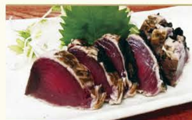
トロかつおのわら焼「龍馬たたき」800円(税別)

脂がたっぷり乗った かつおのたたきには垂涎もの。 香ばしい香りと共に、 鶴亀を一献傾けてみては。