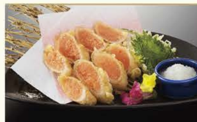
明太子の天ぷら 550円(税別)

絶妙な揚げ具合と食感で、 男女問わず大人気の 「明太子の天ぷら」。 お好みで大根おろしを添えて。