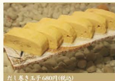
だし巻き玉子 680円(税込)

素材を活かした料理は いずれも繊細で優しい味わい。 だし巻き玉子のふわふわの 食感ほまるでつまむ茶碗蒸し。