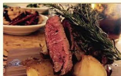
牛ハラミ焼肉のグリル 180g 1,180円(税別)

オープンテラスのある空間で 地酒と肉料理を合わせる。 日本酒好きにとって新しい 通な飲み方を試してみたい。