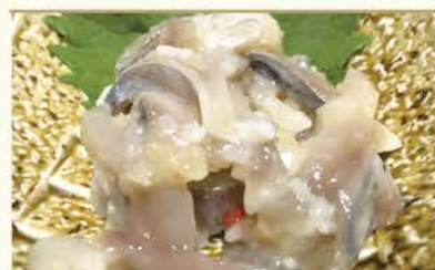
北の魚、練(に)の切り込み 480円(税込)

米麹と塩にしんを 漬けたんだ北国の郷土料理。 塩辛のような味わいは 鶴亀がクイクイすすむ。