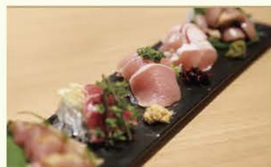
「朝びき鶏刺し」 1,280円(税別)

毎日売り切れ必至! 鮮度抜群の「朝びき鶏刺し」。 鶏の創作料理と地酒の 組み合わせは絶妙。