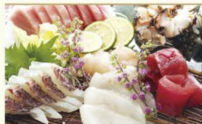
おまかせお刺身盛り合わせ 3,600円(税別)

高田馬場の奥座敷とも 言える大人の空間。 旬の山海の幸を肴に 旨い地酒を味わう。