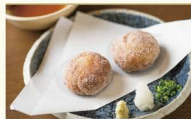
蟹しんじょう1ヶ 400円(税別)

旨い酒と旬の肴で 仲間や家族と語り尽くす。 鶴亀が飲み放題コースに。 宴会のご予約大歓迎!